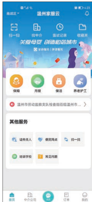
▲ “温州家服云”平台架起雇主与保姆间的高效沟通桥梁

今年以来，市人力社保局以数字化改革为引领，紧扣省、市数改工作有关部署要求，从小切口谋划大应用，聚焦民生关键小事，全力打造“四个一”业务智能速办应用场景，有力破除民生服务痛点堵点难点，让群众切实感受“数字+人社”服务的舒心和便捷。