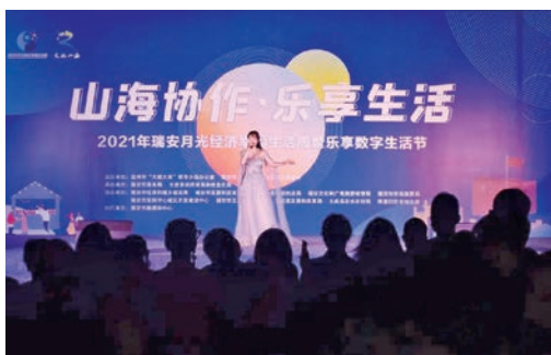
7月12日，2021年温州市月光经济幸福生活周瑞安分会场活动落幕，活动首次走出市区，标志我市月光经济打造正由“两线三片”向“全城全域”拓展