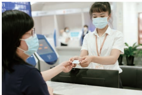
▲ 为市民制作第三代社会保障卡，全流程只需5分钟