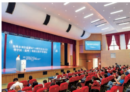
7月23日，温州市刘伯温诞辰710周年纪念大会暨中国（温州）刘基文化学术论坛拉开序幕，全国各地专家学者、刘氏宗亲、刘基文化爱好者相聚伯温故里纪念先贤