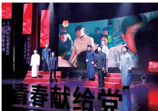
7月29日，第十七届温州青年文化节开幕式在市青少年活动中心举行，各界青少年代表约200人参加，线上12余万名网友观看了活动直播