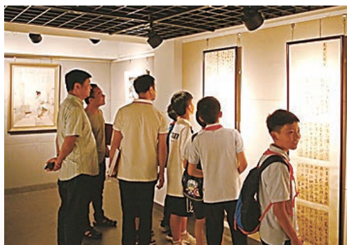
建党百年到来之际，我市美术馆开展庆祝建党100周年“百年追梦”书画作品展