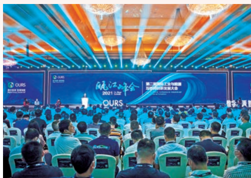
7月9日，2021瓯江峰会·第二届国际工业与能源互联网创新发展大会在我市开幕