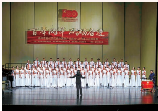
7月2日，“百年风华 砥砺前行”市直机关庆祝中国共产党成立100周年大合唱比赛在温州大剧院举行，来自市直机关22支合唱队、1500多名党员干部以合唱形式深情表达对党的热爱和祝福