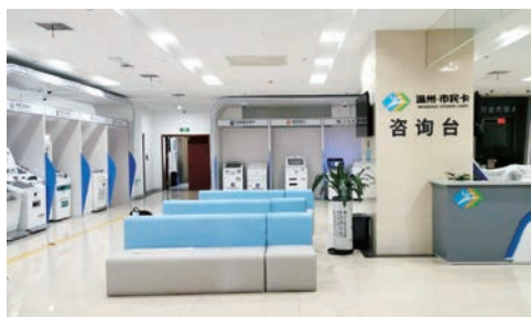
▲ 我市率先探索“智慧服务大厅”建设，实现25项业务全流程智办